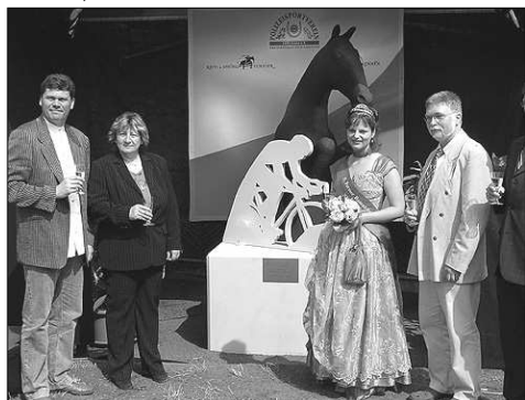
Enthüllung einer Skulptur (Einheit von Rad- und Reitsport darstellend), gesponsert von Firmengruppe Helbeck