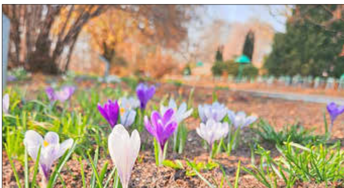
Frühlingserwachen im Ostdeutschen Rosengarten