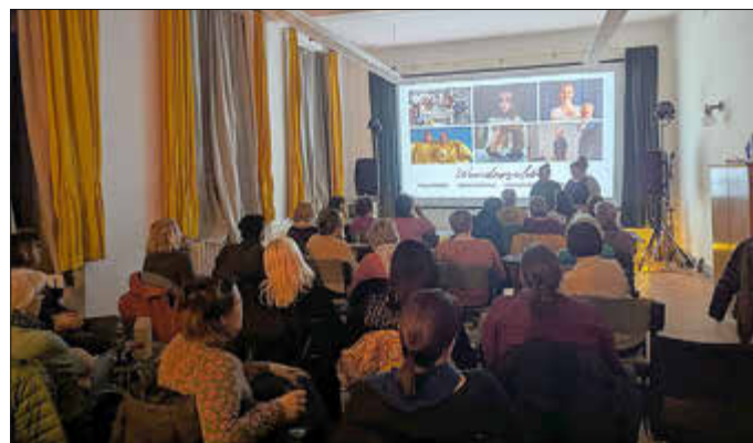
Kinoabend am 21. März