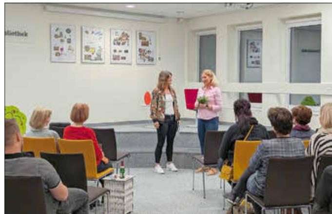
Lesung in der Stadtbibliothek am 13. März