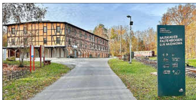
Alte Ziegelei in Klein Kölzig