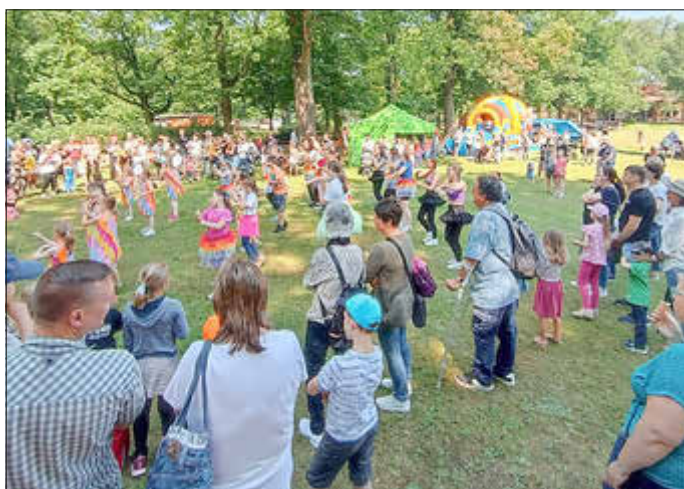
Kindertag im Ostdeutschen Rosengarten

Am 1. Juni 2025, dem internationalen Kindertag können die Kinder im Wehrinselpark von 10 bis 17 Uhr wieder kreativ werden, neue Dinge entdecken und sich natürlich sportlich auspowern. Die Forster Sportvereine präsentieren sich und bieten für jeden das Passende. Der Eintritt ist natürlich frei.