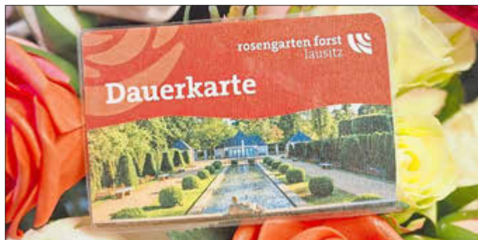
Dauerkarte für die Rosengartensaison 2025

Der Ostdeutsche Rosengarten Forst (Lausitz) lädt alle Gäste ein, einen unvergesslichen Tag im Zeichen der Rosen und der Musik zu erleben. Mit einem abwechslungsreichen Programm, das sowohl für Familien als auch für Paare etwas zu bieten hat, wird die Saison 2025 auf besondere Weise eröffnet.