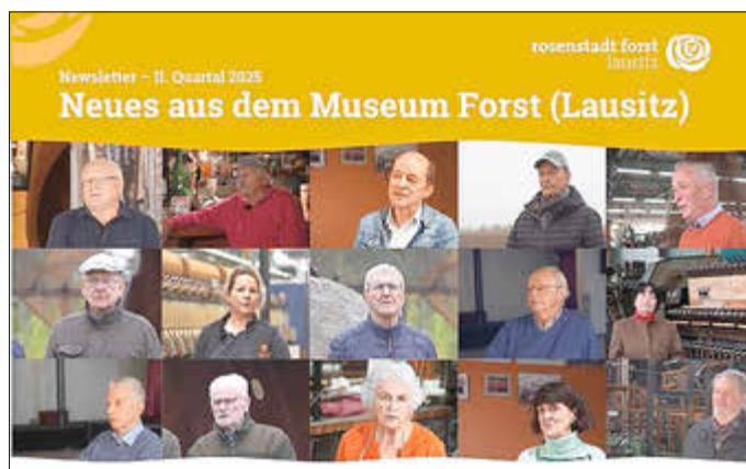
Abbildung: Deckblatt Newsletter II/2025

Der zweite Newsletter unseres Museums ist erschienen. Darin geht es unter anderem um ein innovatives Zukunftslabor, das die Energiewende mit den kommenden Technologien zur Energiegewinnung greifbar machen wird, um die Kunst am Museumsbau und ein Projekt zum Erhalt der vielfältigen Stimmen unserer Stadt und der Region. Sie möchten zukünftig unseren Newsletter direkt per E-Mail erhalten? Dann melden Sie sich gerne kostenfrei an. Schreiben Sie uns dazu eine E-Mail an info@textilmuseum-forst.de oder rufen Sie uns unter 03562 97356 an.