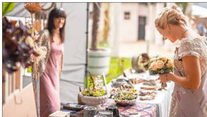
32. Forster Rosenkönigin beim Rosengartensonntag