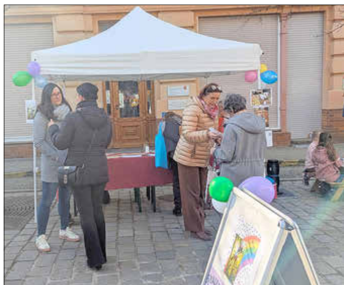
Aktion des Forster Frauenstammtisches am 8. März