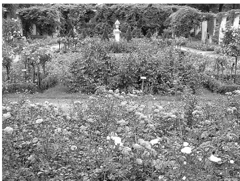
Der Pergolenhof steht in voller Blüte

Bereits am Freitag strömten hunderte Gäste auf das Festgelände. Die Eröffnung der Schnittrosenschau, ein unterhaltsames Seniorenprogramm und die abendliche Theateraufführung lockten trotz grauen Himmels Besucher aus nah und fern in den Ostdeutschen Rosengarten.