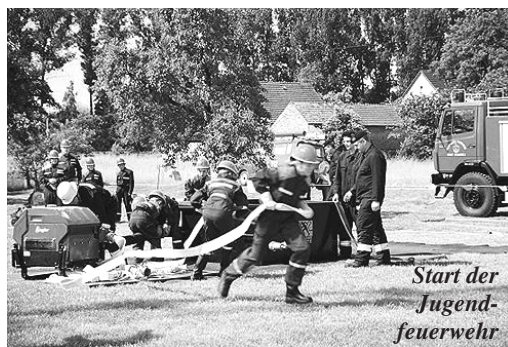
Start der Jugend- feuerwehr

Der Dank gilt allen, die diesen historischen Feiertag für die Mulknitzer Feuerwehr vorbereitet und durchführten.