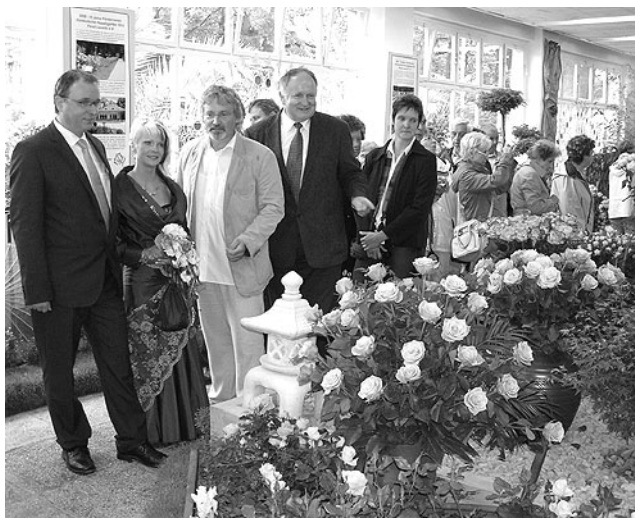
Rundgang durch die Schnittrosenschau »China Girl«