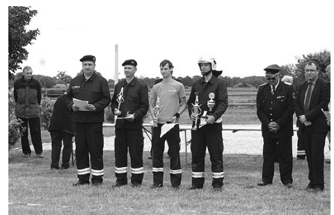
Die Sieger mit dem Bürgermeister