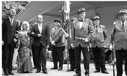
Eröffnung der Rosengartenfesttage 2009

Ein ereignisreiches Wochenende für Besucher, Mitwirkende, Organisatoren und Veranstaltungspartner – mit Sonne und Regen, mit Gesang und Tanz, mit Action und Besinnlichem ist vorüber und hat nicht nur bei den zahlreichen Besuchern einen freudigen Eindruck hinterlassen.